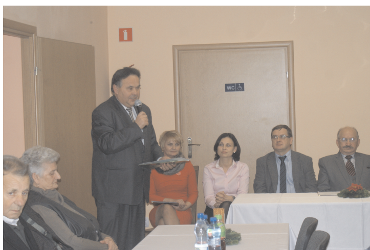
Gminny Konkurs Szopek Bożonarodzeniowych w CKiP

Noworoczne spotkanie PSL i Koła Emerytów Rencistów i Inwalidów