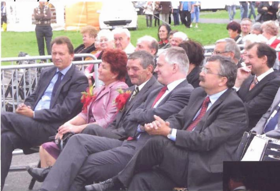
Liderzy w otoczeniu posłów na sejm RP: Jacka Krupy, Jarosława Gowina, Andrzeja Adameczyka