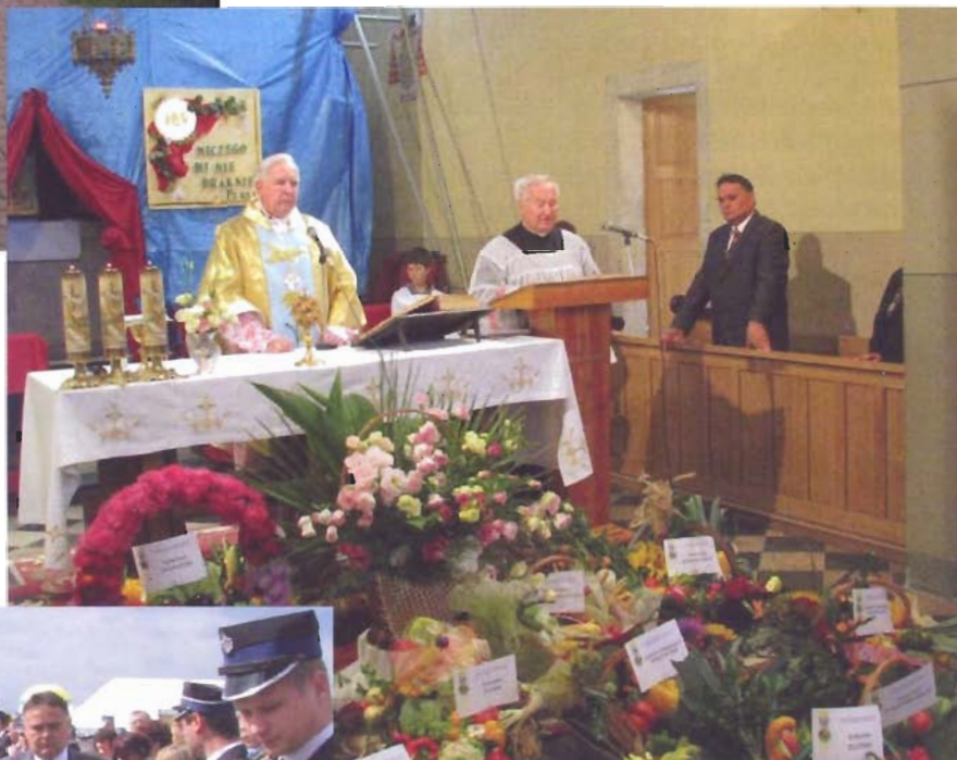
Delegacje sołectw udają się na mszę ↑